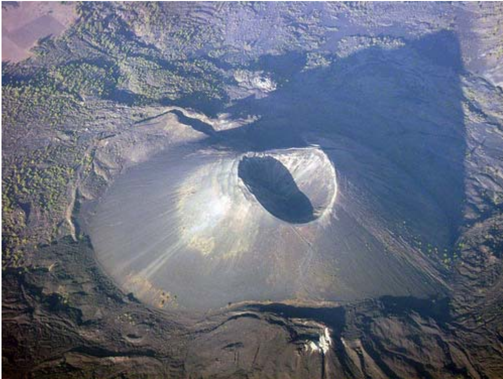
Vista aérea del cono volcánico y de su cráter