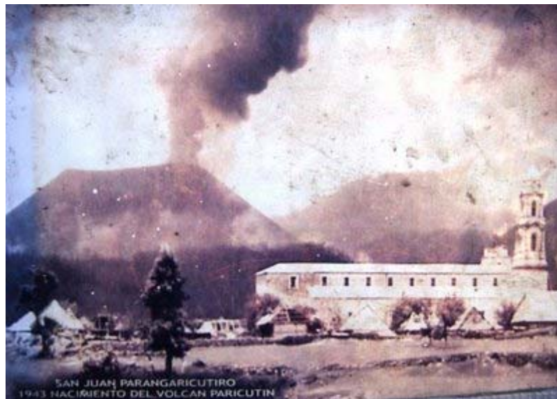
El volcán Parícutín “recién nacido” cuando su lava no había sepultado todavía el pueblo de San Juan de Parangaricutiro.