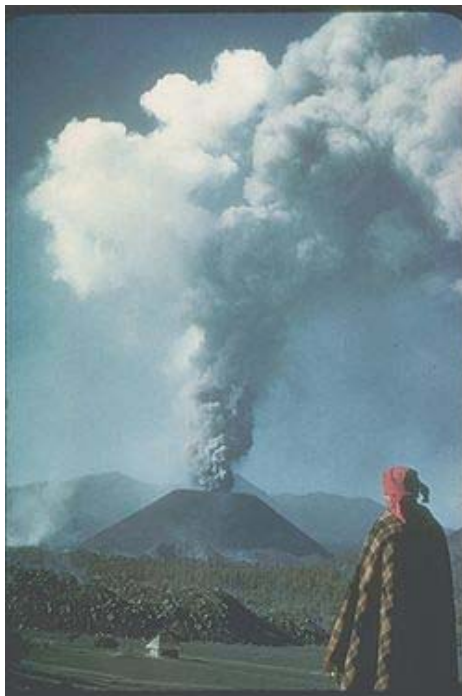
El volcán Paricutín arrojando cenizas

La actividad del volcán duró 9 años, 11 días y 10 horas. No hubo víctimas porque hubo tiempo suficiente para que todos se salvaron, sin embargo, sepultó dos pueblos: Paricutín y San Juan Viejo Parangaricutiro. El primero quedó totalmente borrado del mapa y del segundo sólo asoma la torre de la iglesia.