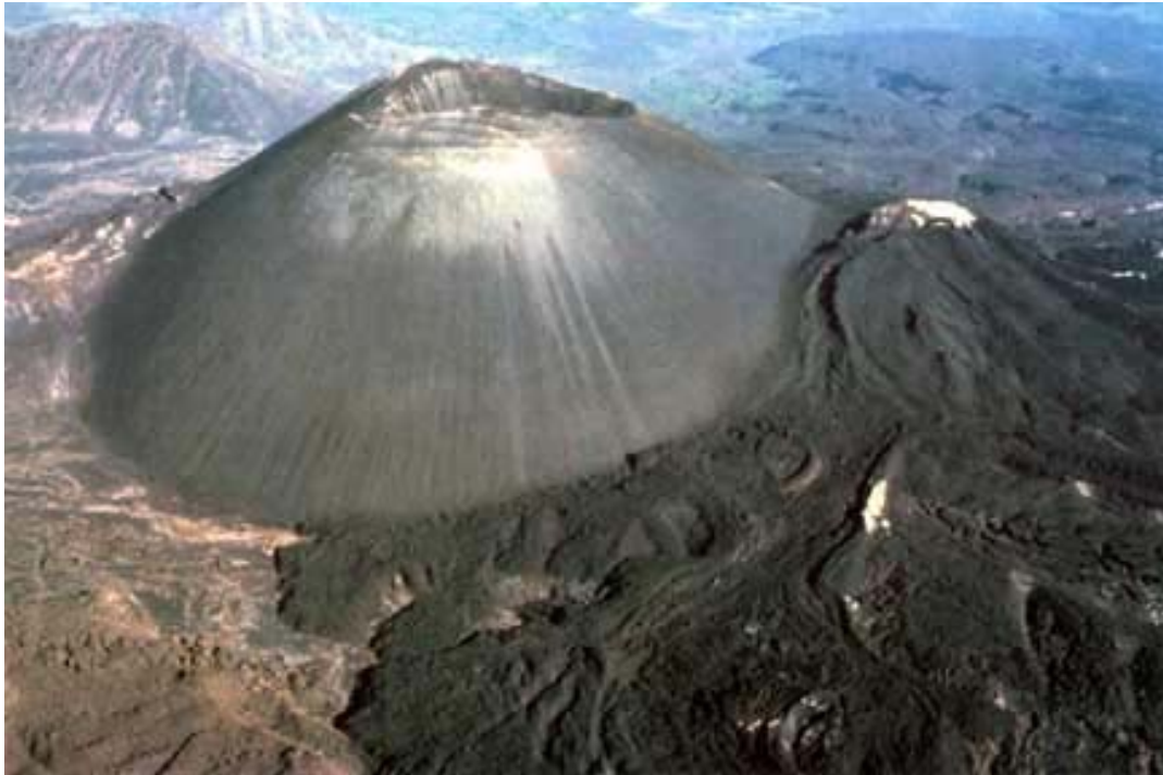
Cono de cenizas y colada de lava lateral